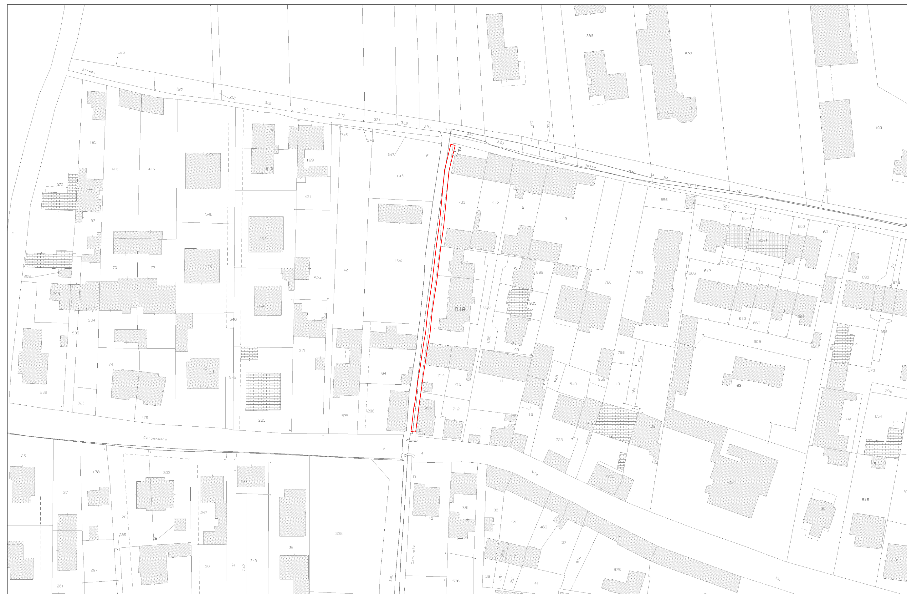
INDIVIDUAZIONE INTERVENTO SU CATASTALE - Scala 1:1000